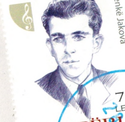
FIGURA TË SHQUARA KOMBËTARE