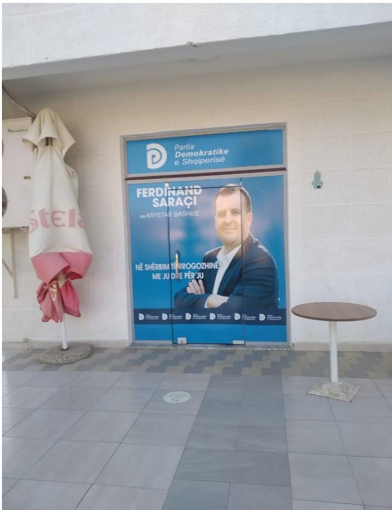
Zyra elektorale Njesia administrative Kryevidh.