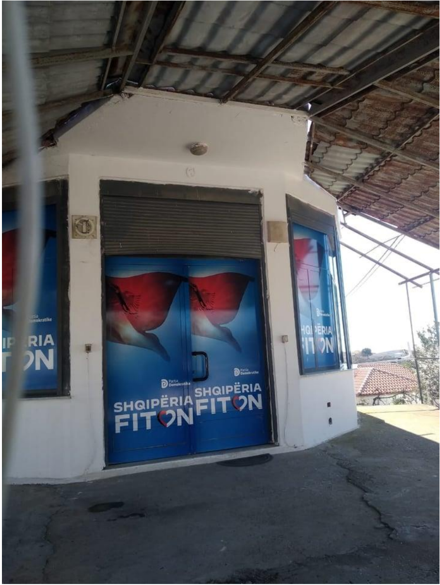
Zyra elektorale Njesia administrative Kryeviidh.