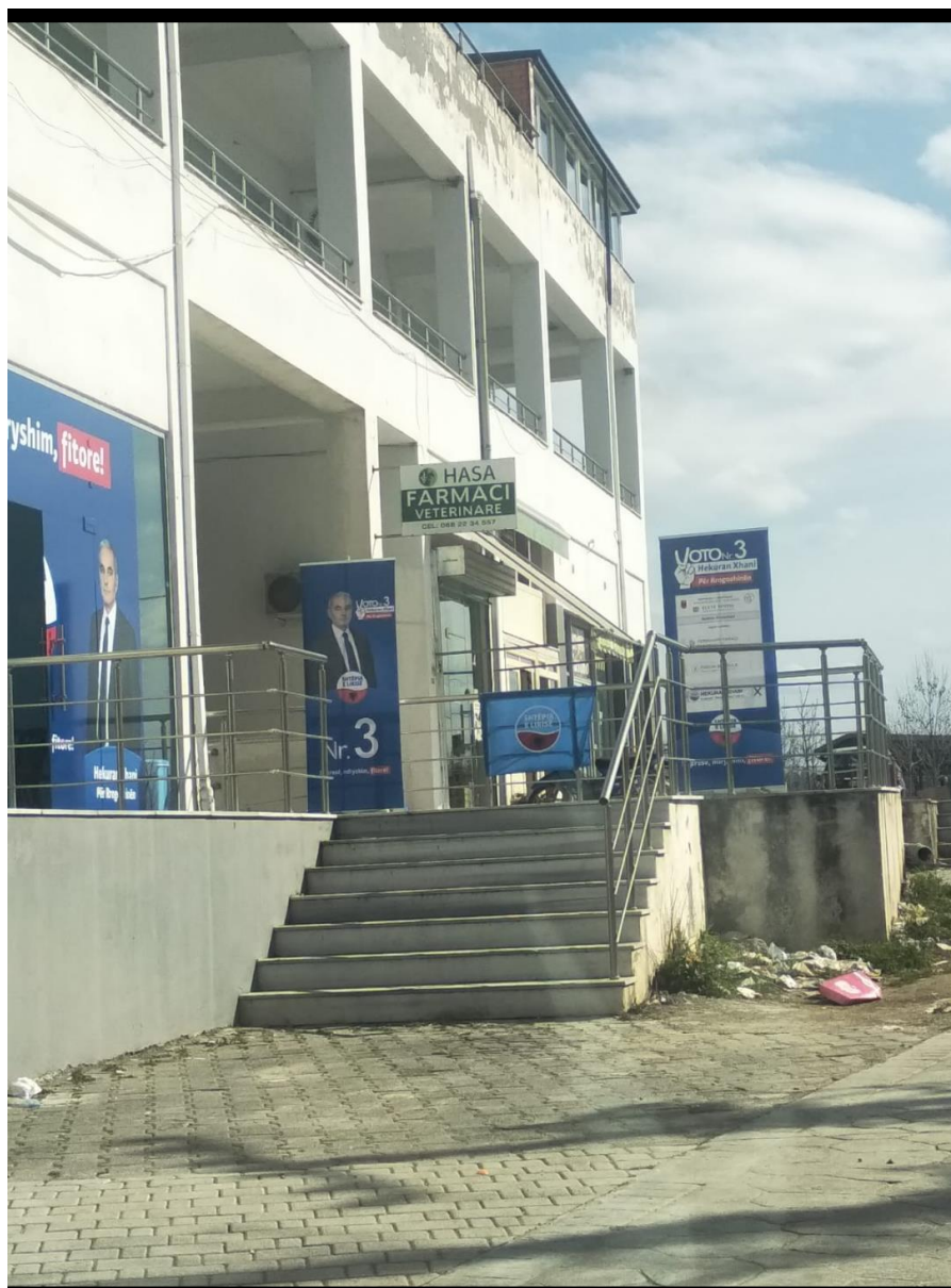
Zyra elektorale Rrogozhine.