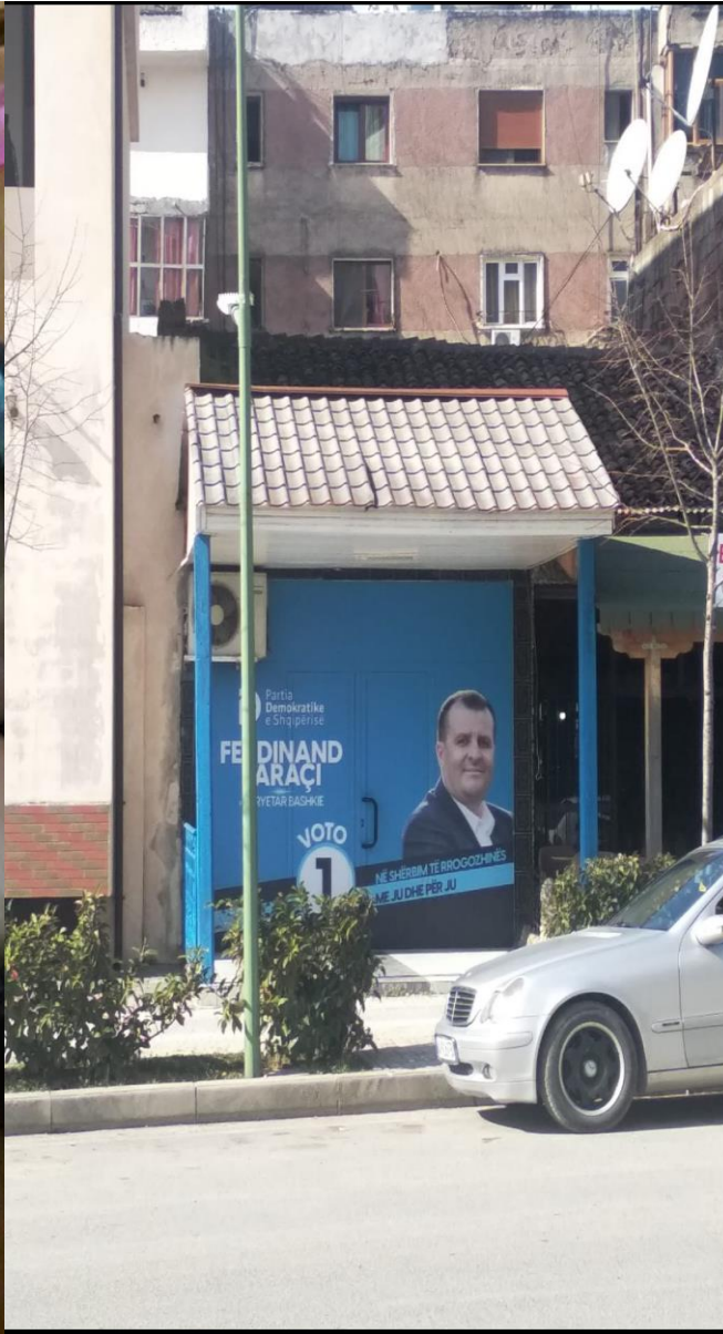
Zyra elektorale Rrogozhine.