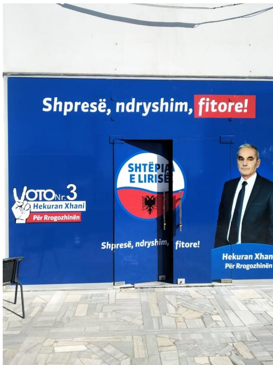
Zyra elektorale Rrogozhine.