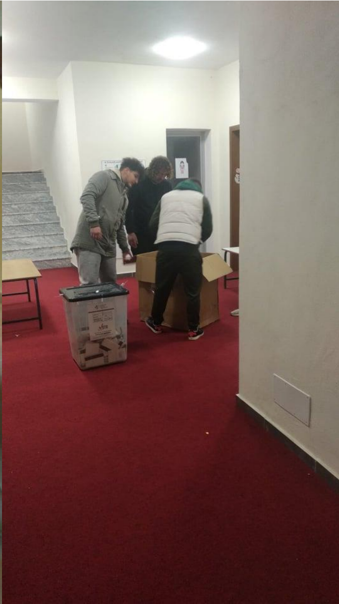
momenti i mbylljes ne QV 2226/1