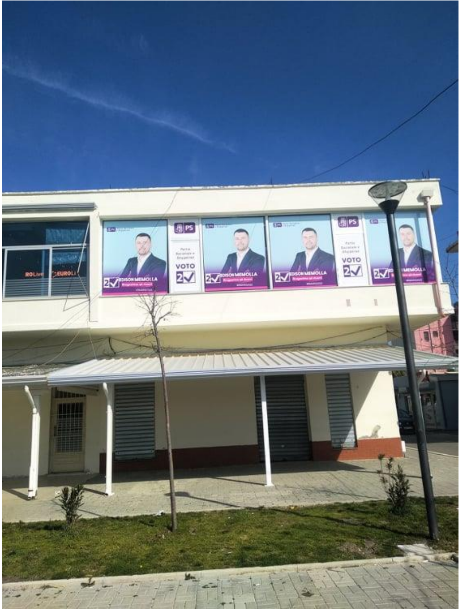
Zyra elektorale Njesia Administrative Gose