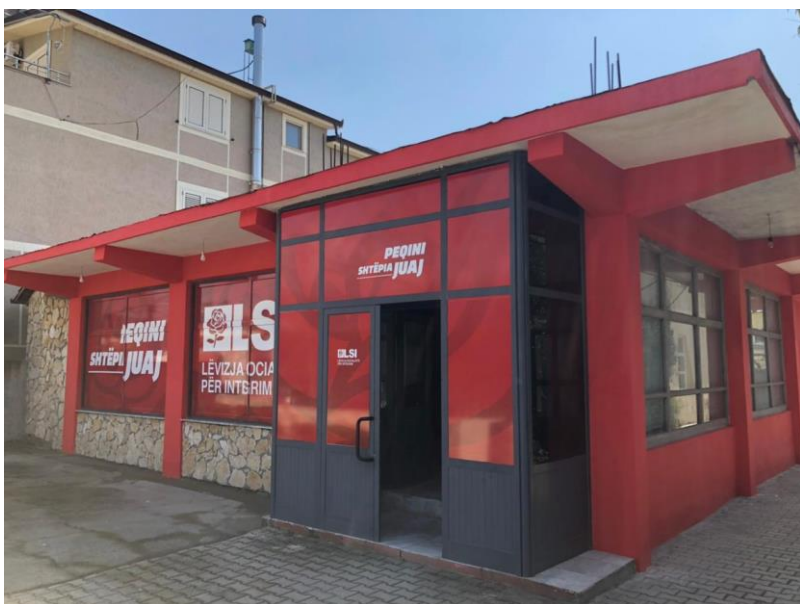
Zyra elektorale e Levizja Socialiste per Integrim ne Bashkine Peqin.