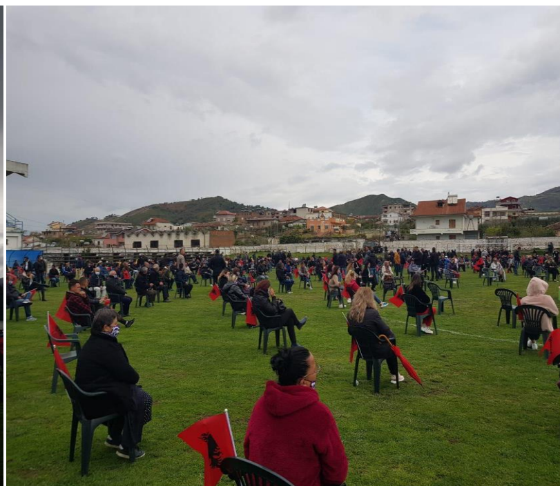
Foto nga fushata zgjedhore ne Peqin stadiumi SHKUMBINI