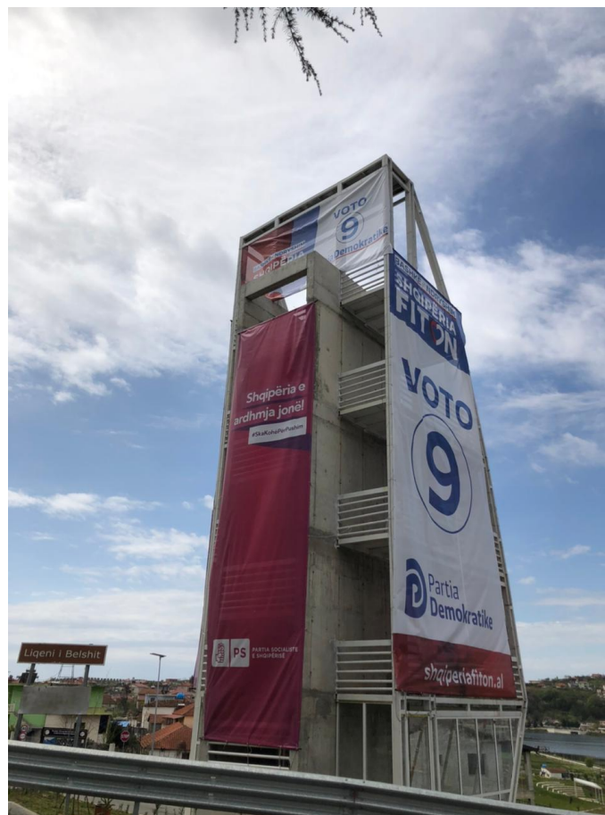
Baner i ngjitur ne qender te