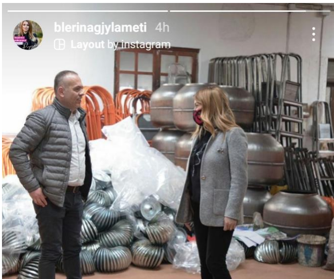
Vizitova biznesin 20 vjeçar "Kreta SH.PK". Biznesi vijon të jetë i suksesshëm në prodhimin e veglave të ndërtimit për tregun vendas dhe atë të huaj, me eksporte në Greqi, Rumani, Kosovë dhe Maqedoni.