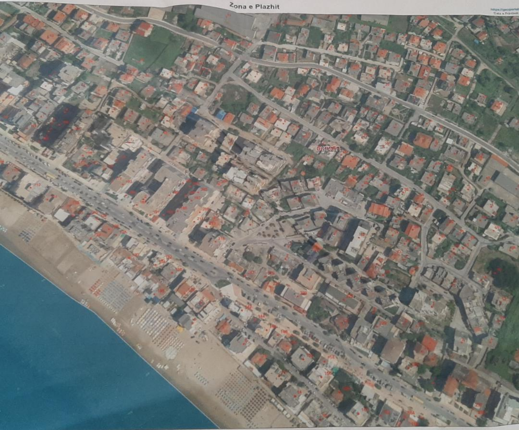
Zona e Plazhit

Agjencia Kombëtare e Menaxhimit të Tokës dhe Planifikimit Urban