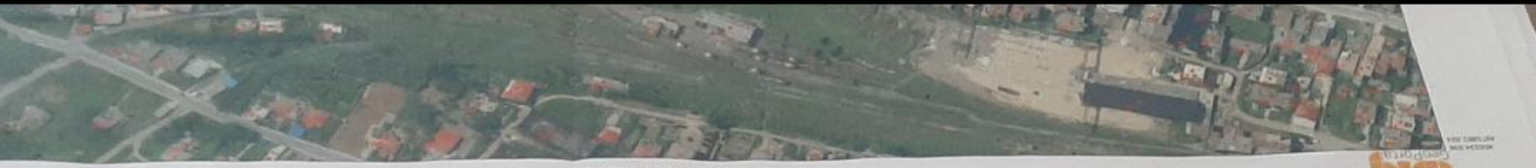
Zona e Plazhit