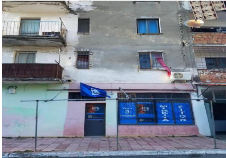
Zyra Zgjedhore PS Rreshen: