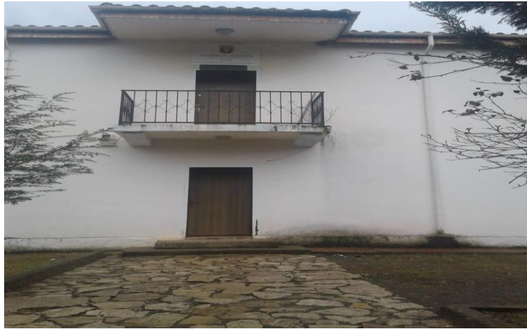
Njësia Administrative Zejmen: