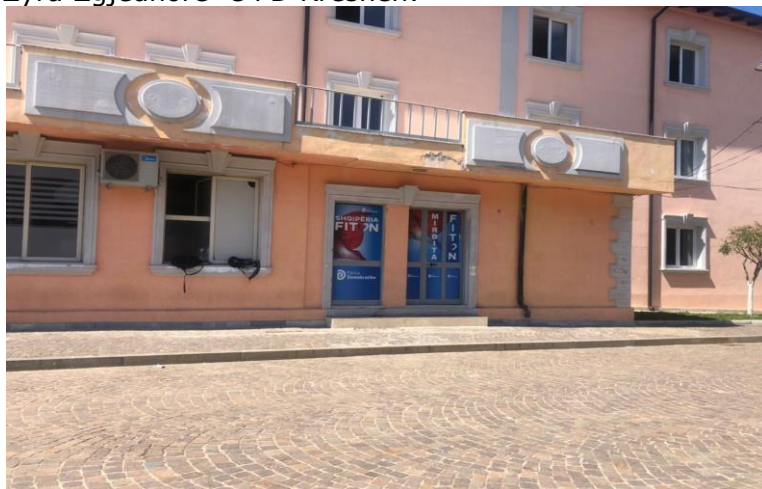
Zyra Zgjedhore PD Rubik: