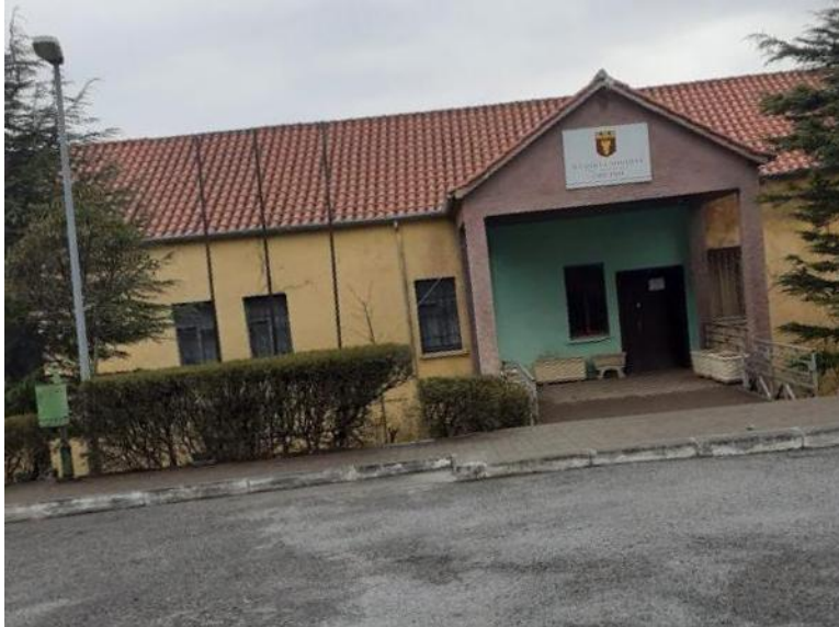
Njësia Administrative Fan: