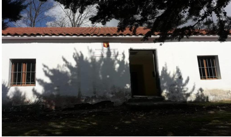
Njësia Administrative Rubik: