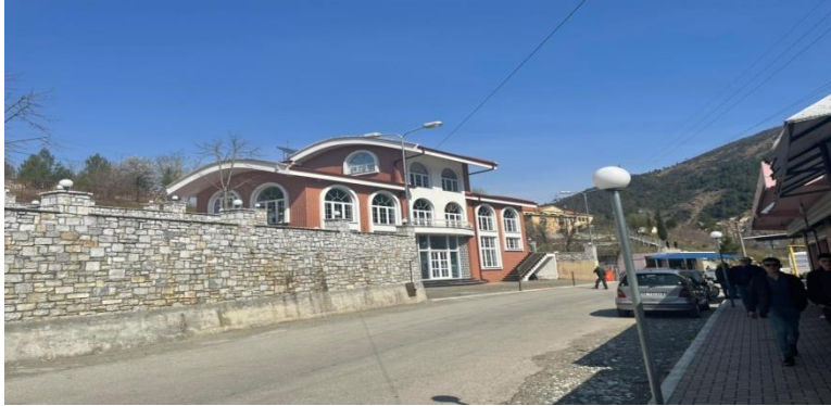
Njësia Administrative Orosh: