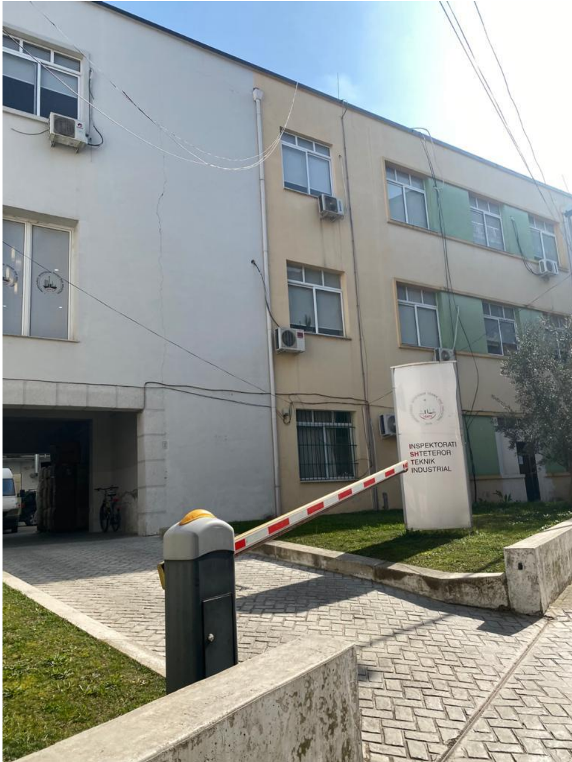
Inspektoriati Shteteror Teknik Industrial

Shenim: Sipas monitorimit ne kete subject nuk u ve re asnje parregullsi