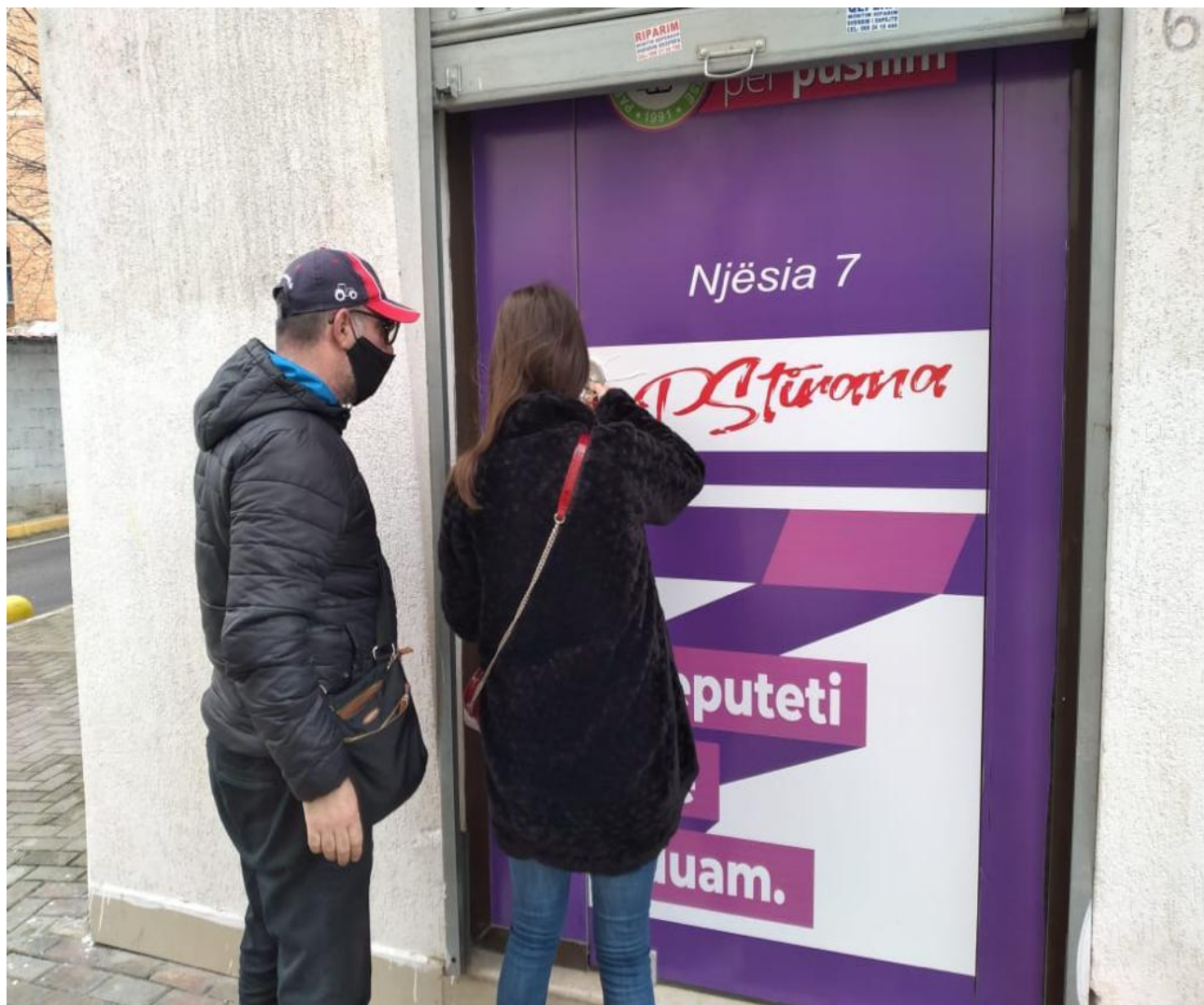
Zyra Elektorale e Partise Socialiste ne Zonen e Zogut te Zi

Shenim: Hyrja kryesore e saj me nje hapsire jo me shume se 1 metra. Materialet propagandistike te perdoruara - leter adeziv me logo te parties politike qe ato perfaqesojne.