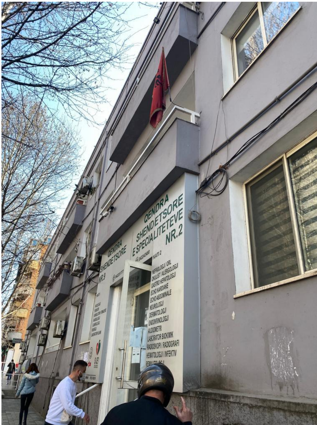
Qendra Shendetesore Nr.9