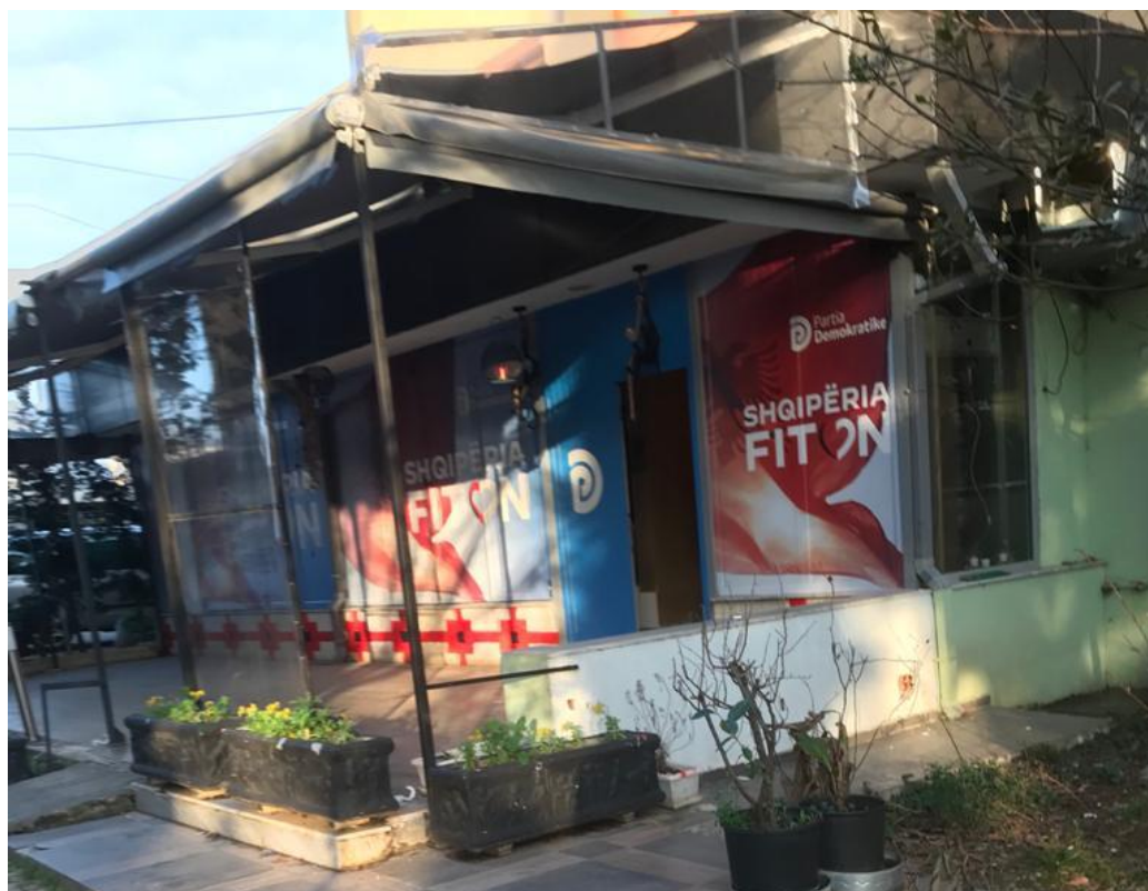
Zyra Elektorale e Partise Demokratike ne Rrugen: ``Naim Frasheri``

Shenim: Hyrja kryesore e saj me nje hapsire jo me shume se 5 meter. Materialet propagandistike te perdoruara - leter adeziv me logo te parties politike qe ato perfaqesojne.