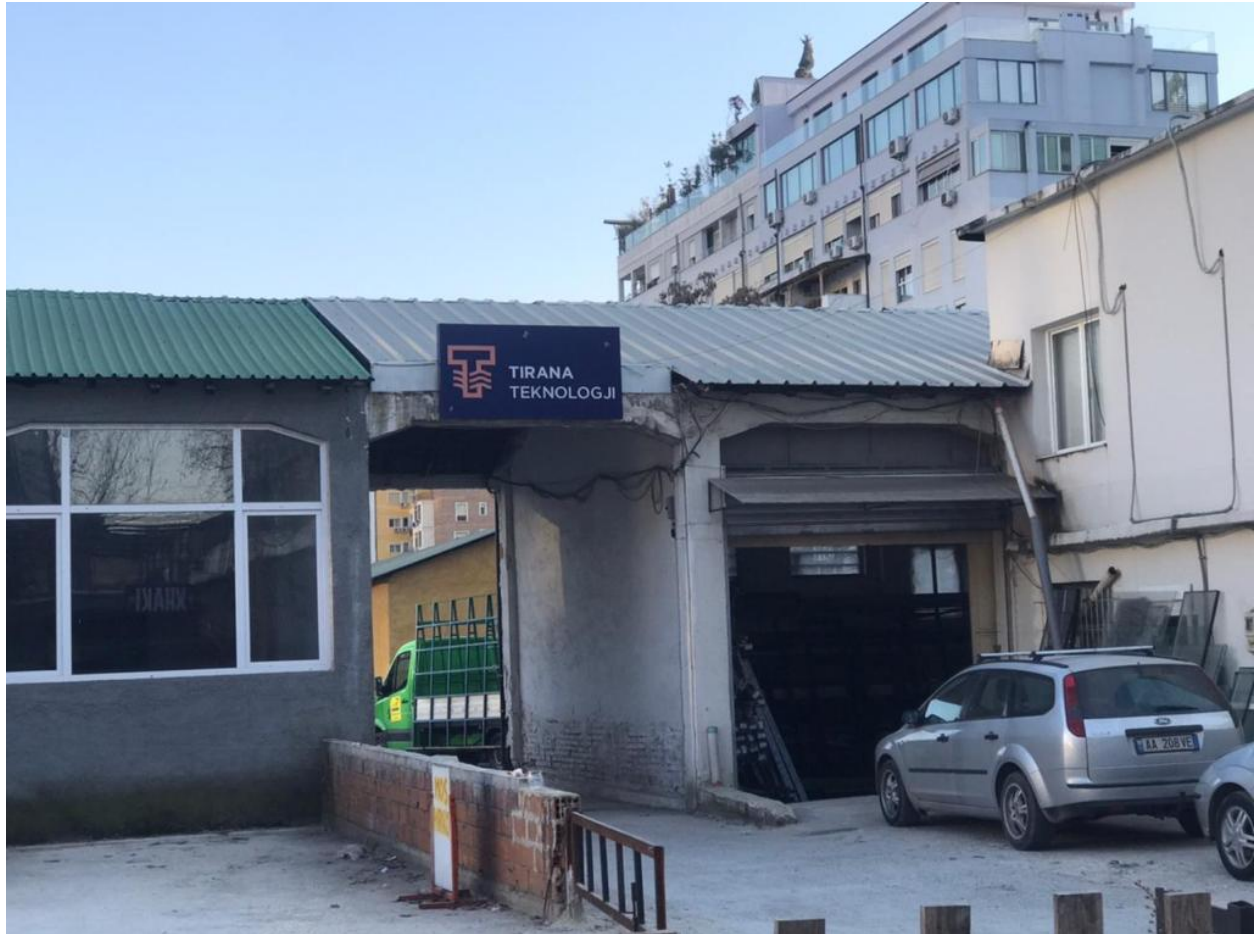
Tirana Teknologji Rruga e Kavajes

Shenim: Sipas monitorimit ne kete subject nuk u ve re asnje parregullsi.