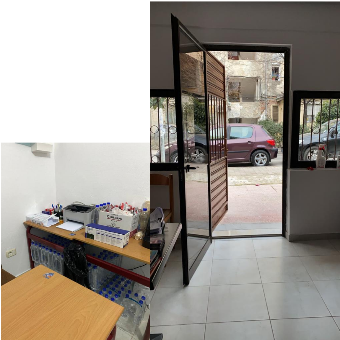
Zyra Elektorale e Partise Socialiste ne Rrugën: "Vangjush Furxhi" pamje nga brenda saj.