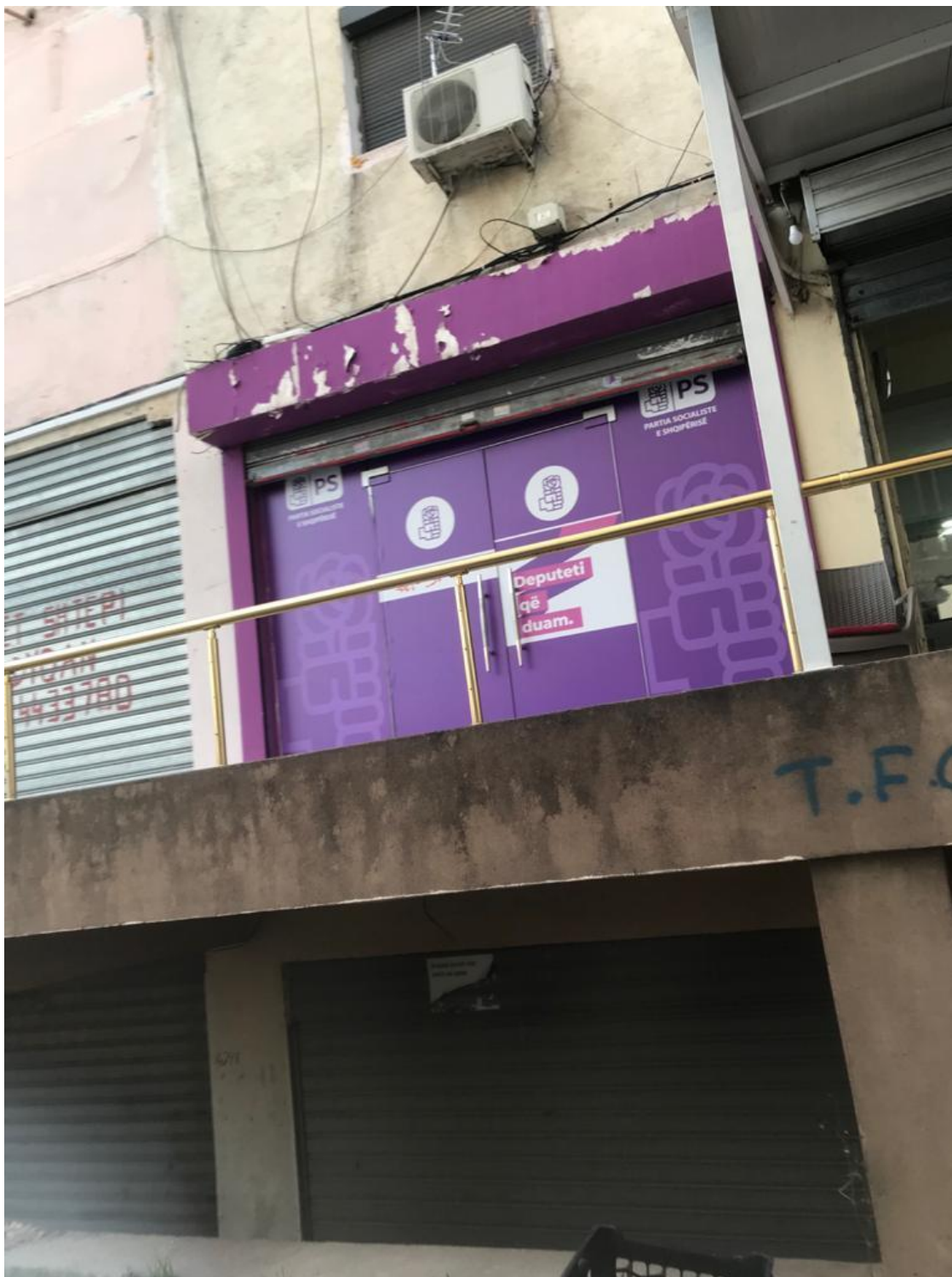
Zyra Elektorale e Partise Socialiste ne Rrugen e Kavajes

Shenim: Hyrja kryesore e saj eshte ne katin e dyte ne pjesen anesore te pallatit me nje hapsire jo me shume se 3 meter. Materialet propagandistike te perdoruara - leter adeziv me logo te parties politike qe ato perfaqesojne.