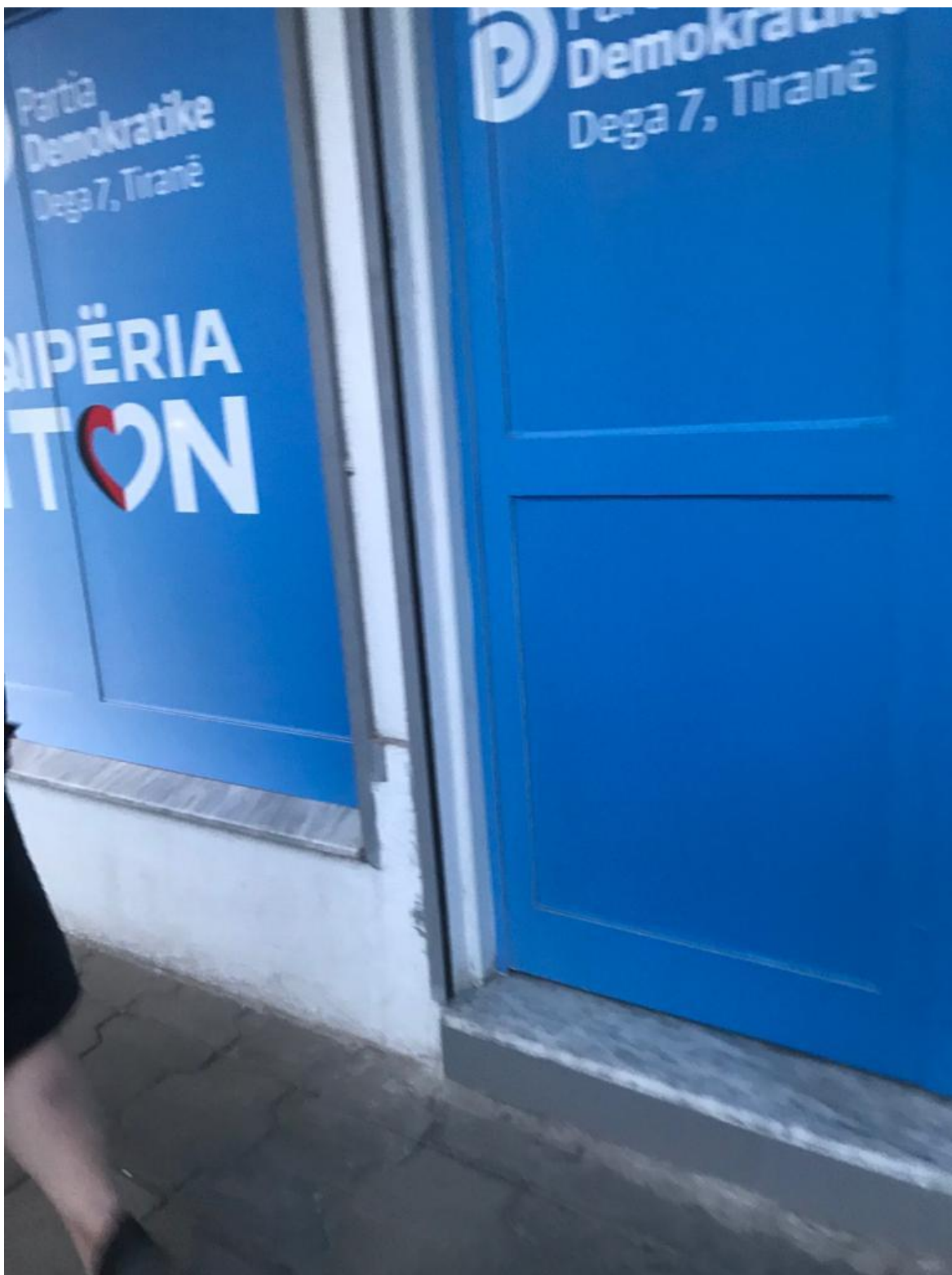
Zyra Elektorale e Partise Demokratike ne zonen e pallateve te Telebingos Shenim: Hyrja kryesore e saj me nje hapsire jo me shume se 3 meter. Materialet propagandistike te perdoruara - leter adeziv me logo te parties politike qe ato perfaqesojne si dhe flamur.