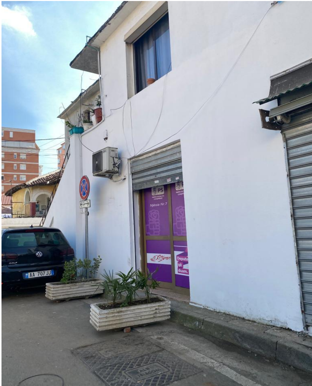
Zyra Elektorale e Partise Socialiste ne Rrugen: ``Him Kolli``

Shenim: Hyrja kryesore e saj me nje hapsire jo me shume se 1 meter. Materialet propagandistike te perdoruara - leter adeziv me logo te parties politike qe ato perfaqesojne.