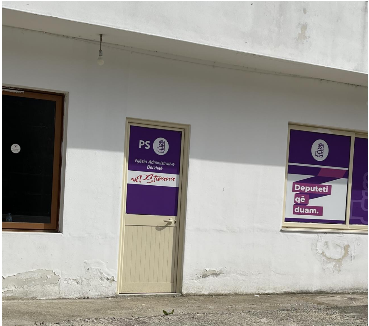
NJESIA ADMINISTRATIVE BERZHITE.