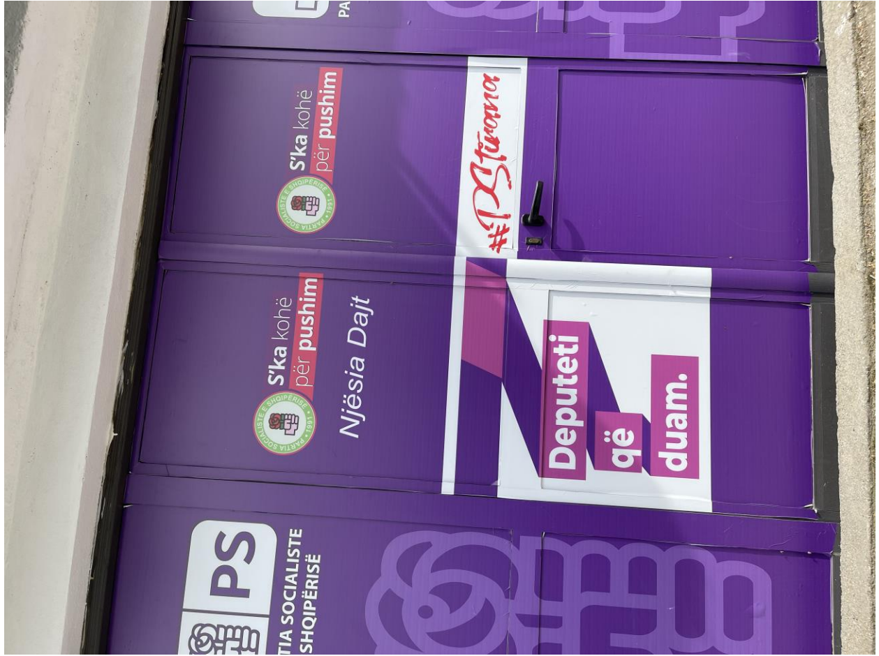
NJESIA ADMINISTRATIVE DAJT (LANABREGAS).