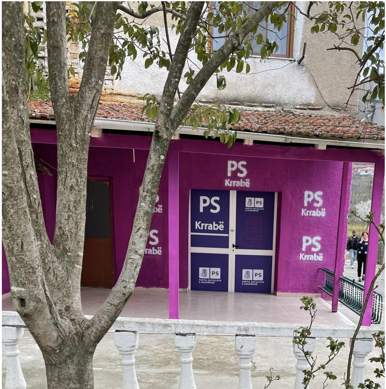
NJESIA ADMINISTRATIVE KRRABE ( QENDER ) .