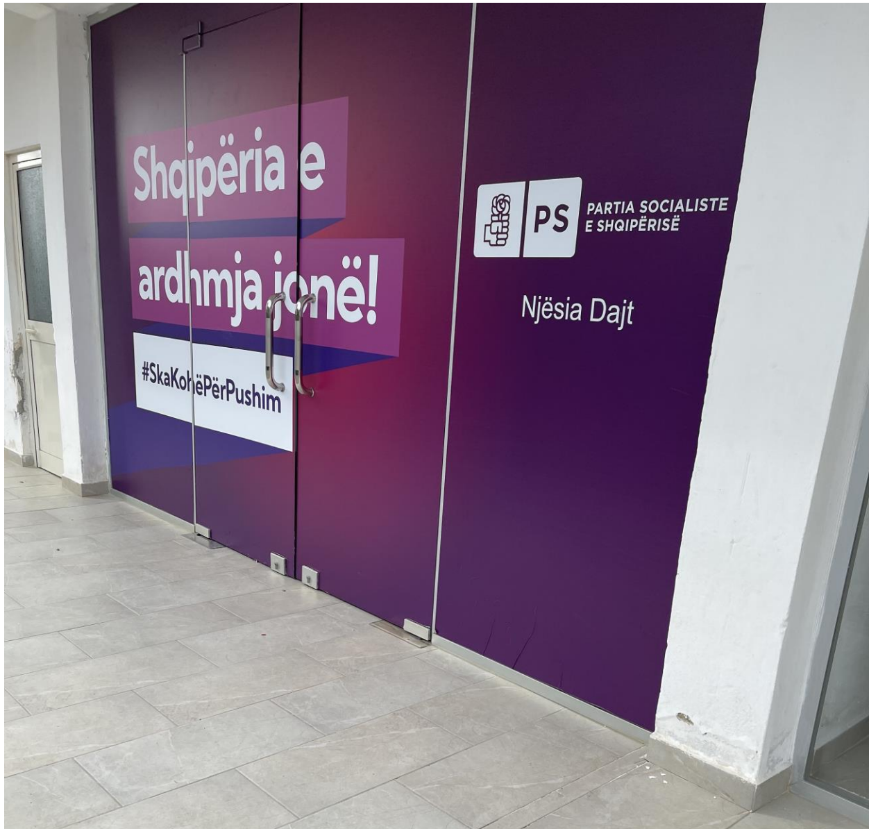
NJESIA ADMINISTRATIVE DAJT (TUFINE) .