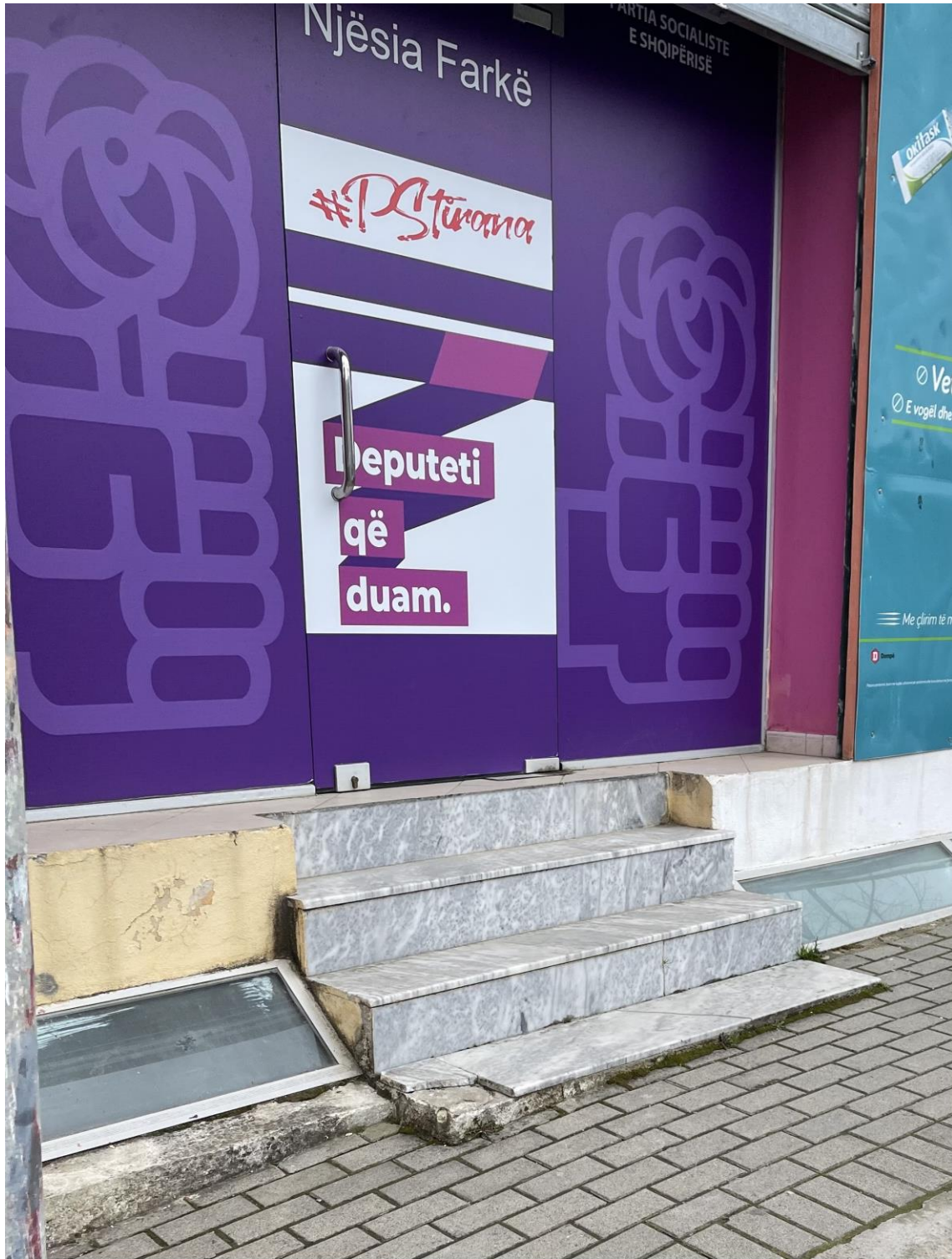
NJESIA ADMINISTRATIVE FARKE.