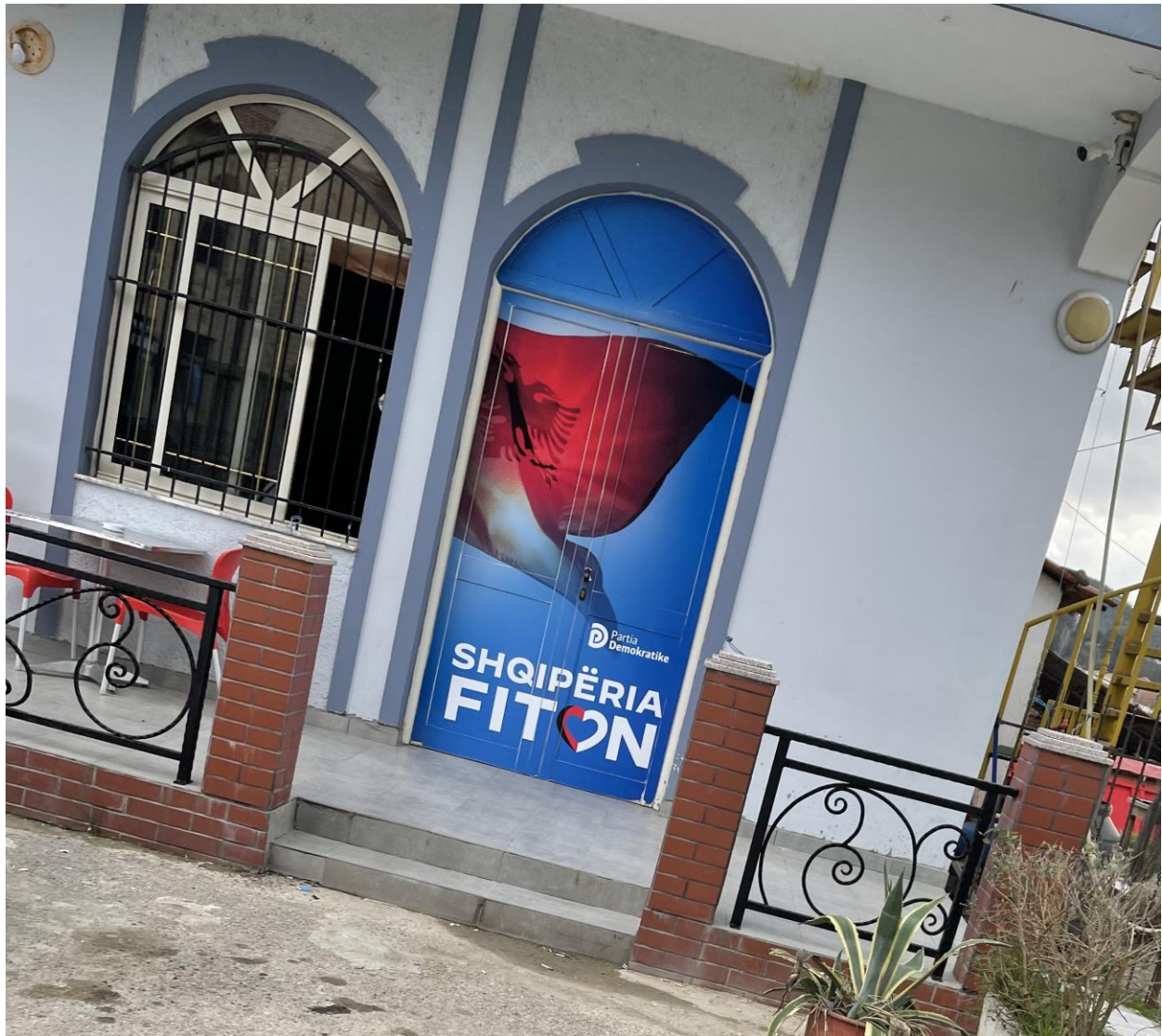
NJESIA ADMINISTRATIVE ZALL-HERR.