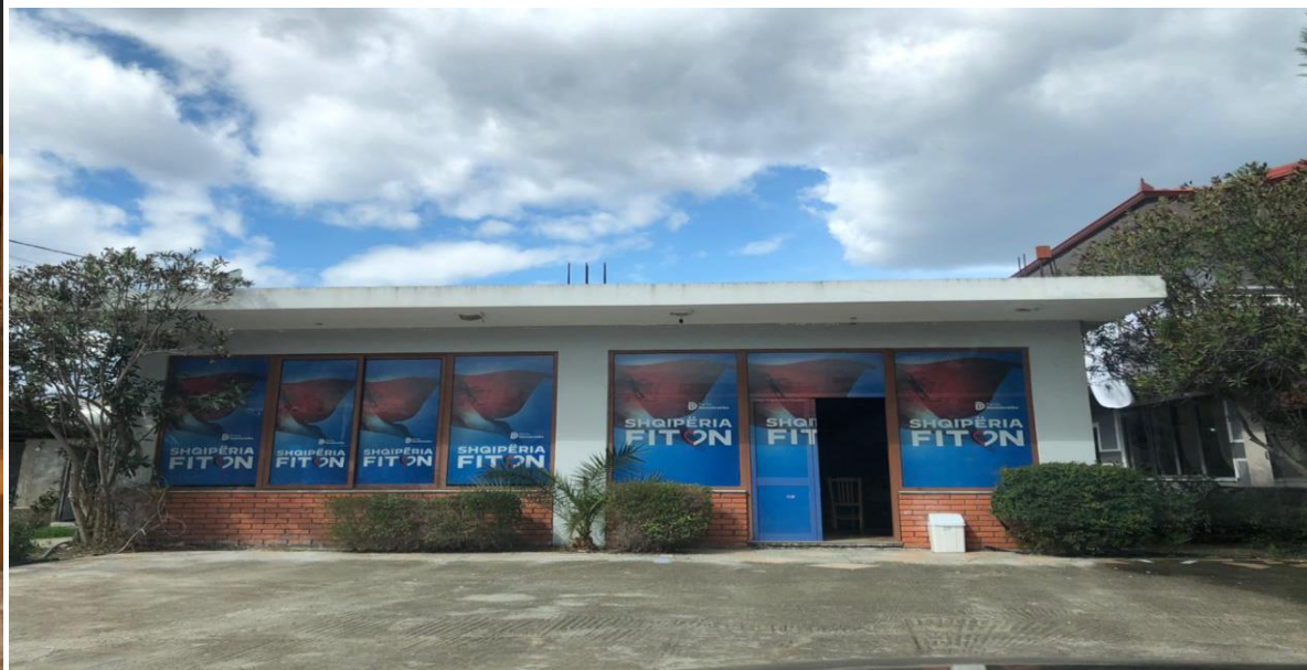
ZYRA ELEKTORALE PARTIA DEMOKRATIKE, NJESIA ADMINSTRATIVE PAJOVE