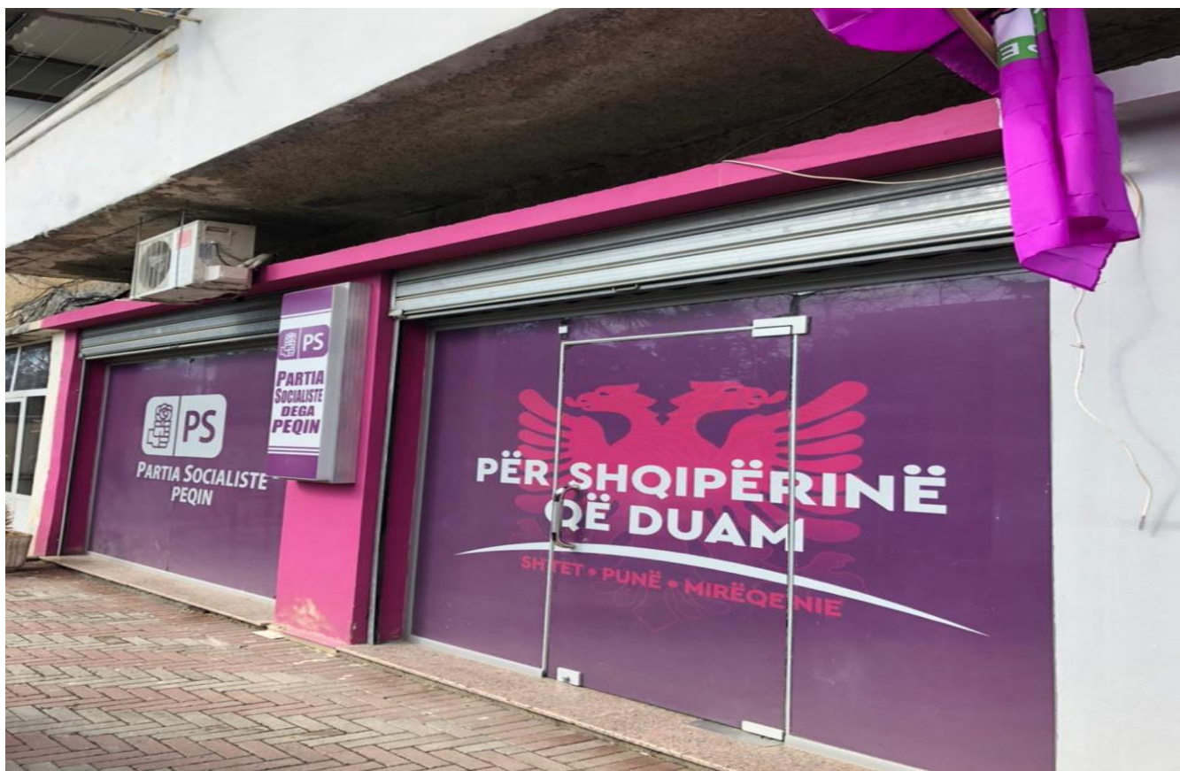
ZYRA ELEKTORALE PARTIA SOCIALSITE, BASHKIA PEQIN