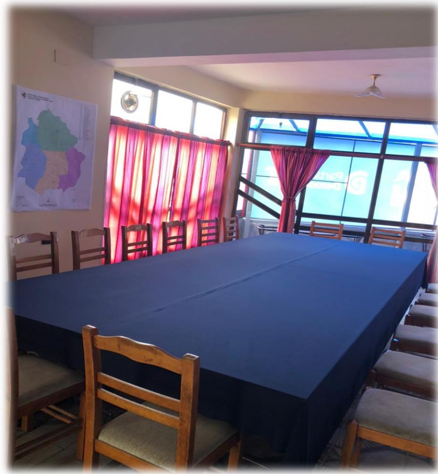
BRENDA ZYRES ELEKTORALE PARTIA DEMOKRATIKE BELSH