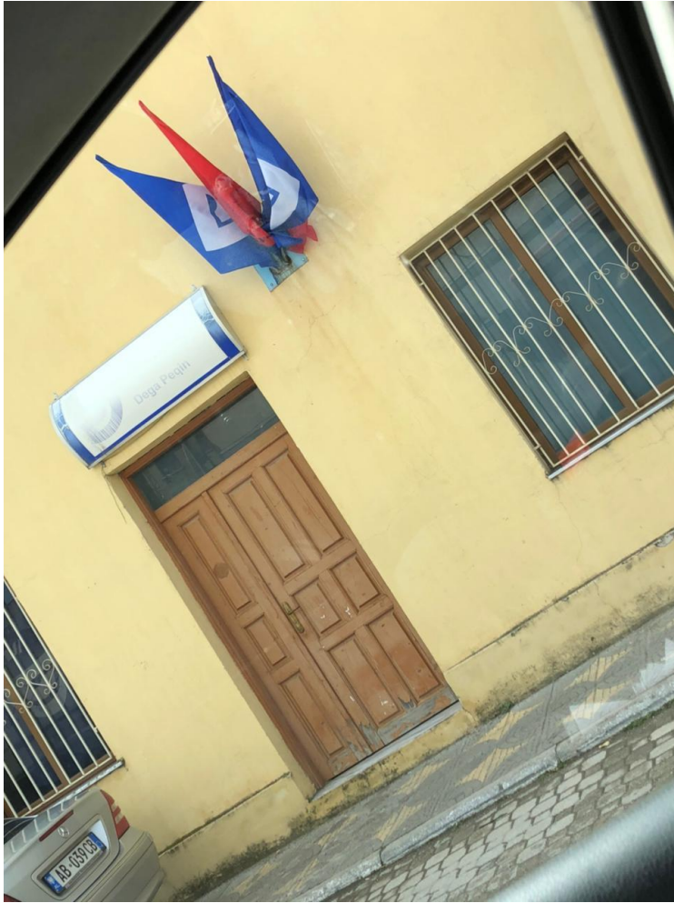
ZYRA ELEKTORALE PARTIA DEMOKRATIKE, BASHKIA PEQIN