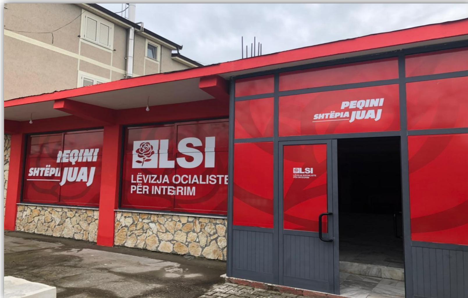
Zyra elektorale e Levizja Socialiste per Integrim ne Bashkine Peqin.