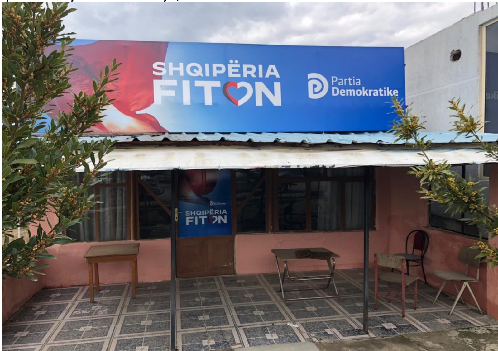
Zyra Elektorale Njesia Adminstrative Kajan,Belsh