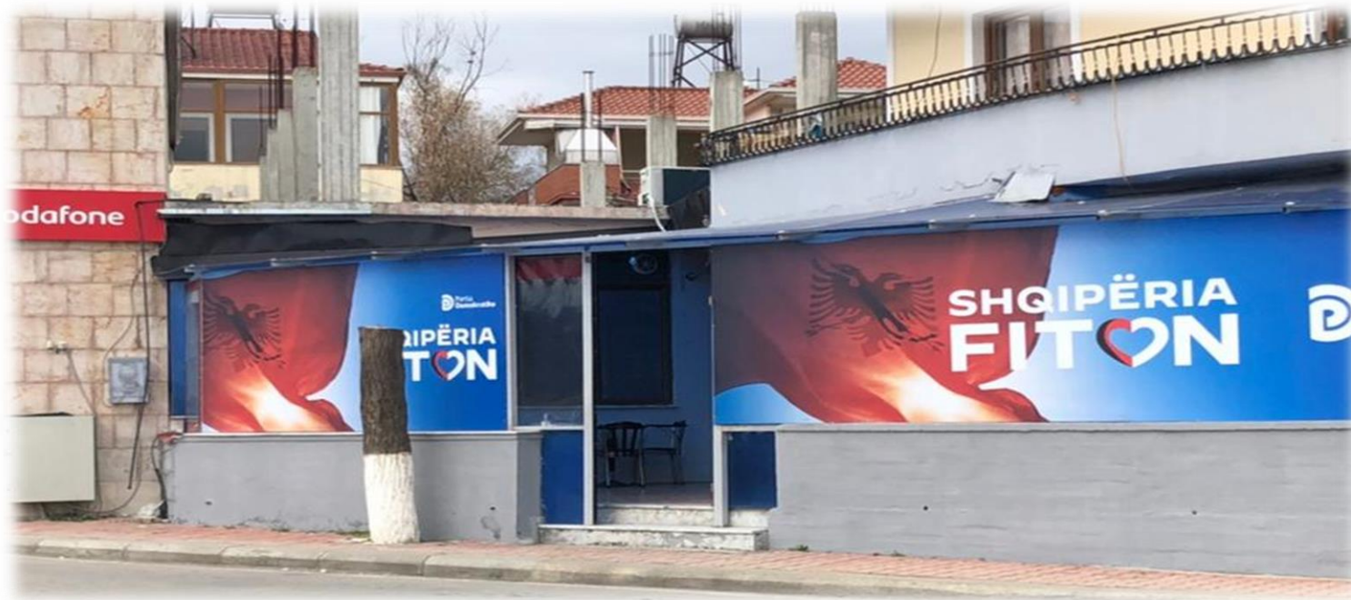
ZYRA ELEKTORALE PARTIA DEMOKRATIKE BASHKIA BELSH