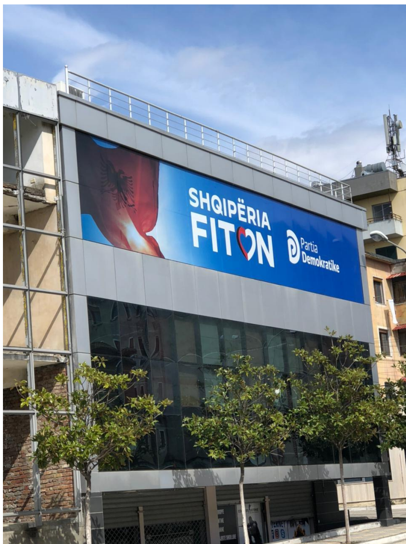
ADEZIV I NGJITUR PRANE DEGES SE PARTIS DEMOKRATIKE PEQIN