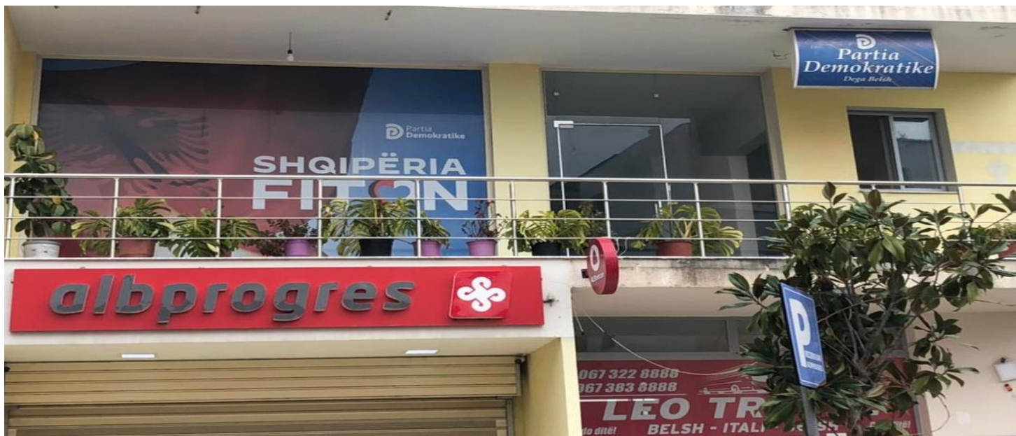
Selia PARTIA DEMOKRATIKE BASHKIA BELSH