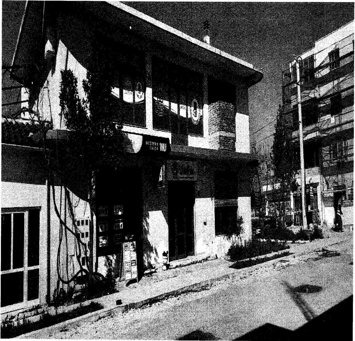
Zyrë e subjektit të Partisë Socialiste fshati Libofshë