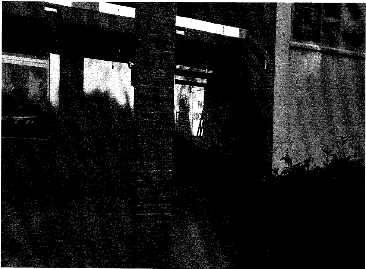
Zyrë e subjektit të Partisë Socialiste Njësia Topojë fshati Seman